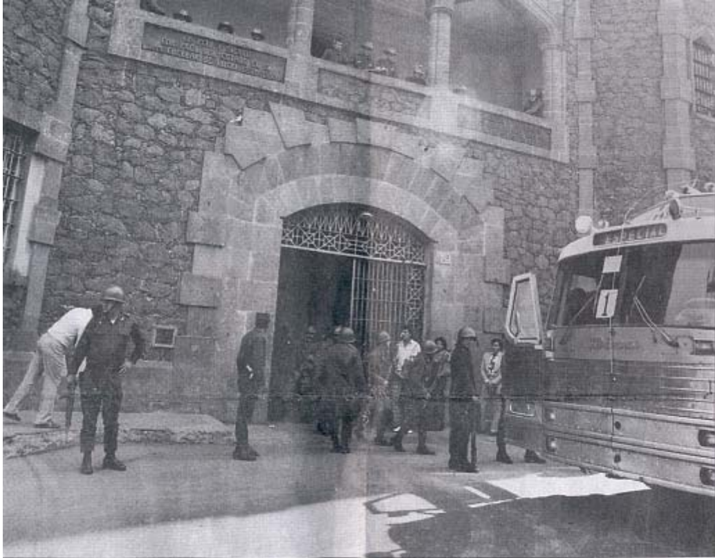
Antigua penal de oblatos donde estuvimos reclusos los guerrilleros, prisión que posteriormente demolieron para hacer una unidad deportiva.

Tenemos plenamente comprobado que cuando se cae en el sedentarismo ideológico el valor se enerva y claudicas a la lucha poniendo miles de pretextos tratando de justificar tu conducta con frases tales como: “no hay condiciones, me preocupa la familia, etc.” Ante estas conductas que el “che” calificaba de “pobres infelices vegetad en paz morid bellamente saturados de hastío o avanzada edad” .