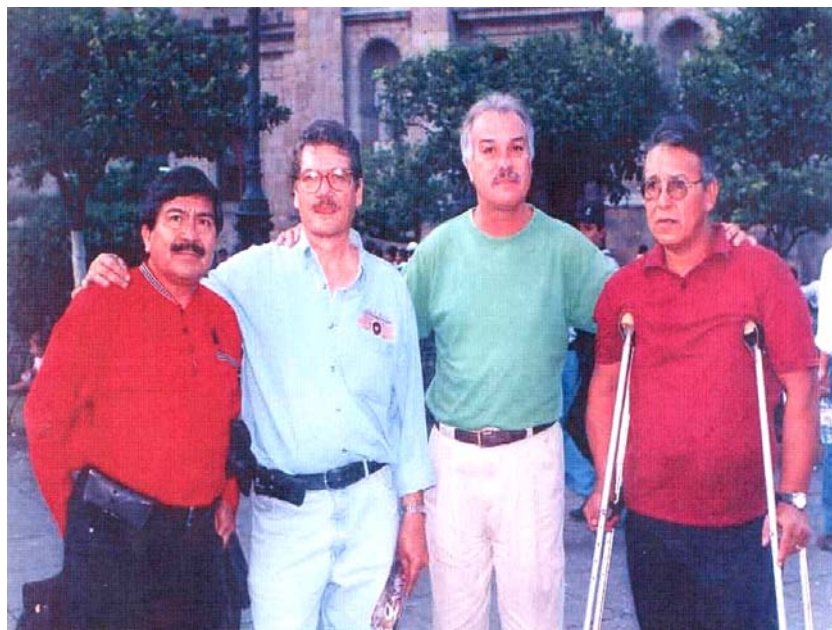
Sobrevivientes de la lucha guerrillera de los años 70s,